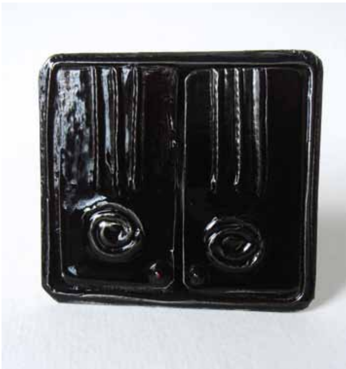
4. Maalaa luukut esim. spraymaalilla.