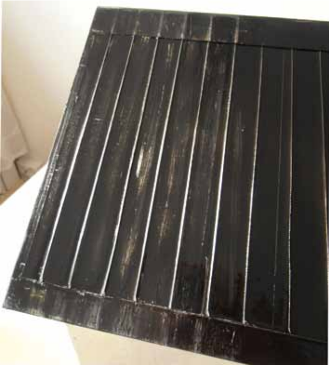
10. Saumakohtia voi korostaa hiomalla niiden päältä varovasti. Jos haluaa kuluneen katon kuten tässä, hiotaan hiekkapaperilla reilusti maalia pois.