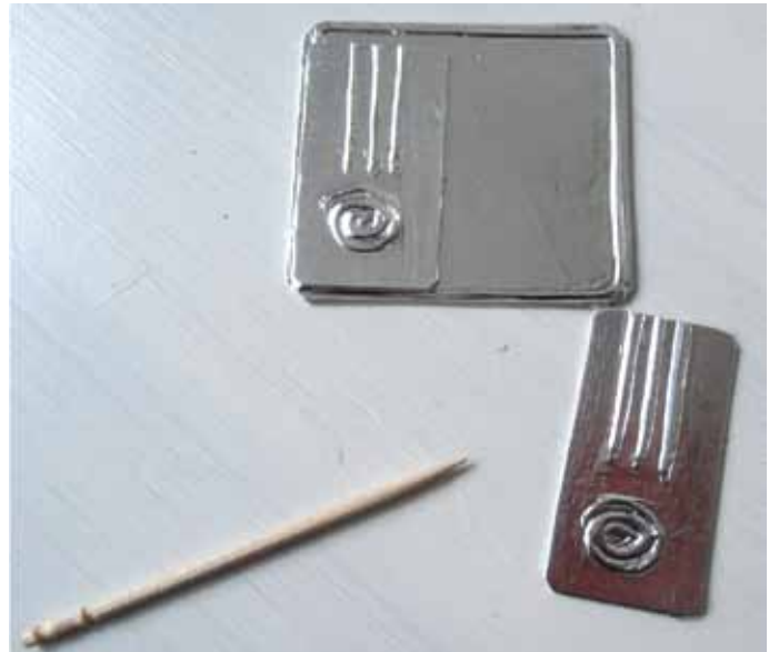
2. Teippaa uuninluukut folioteipillä lankojen päältä.