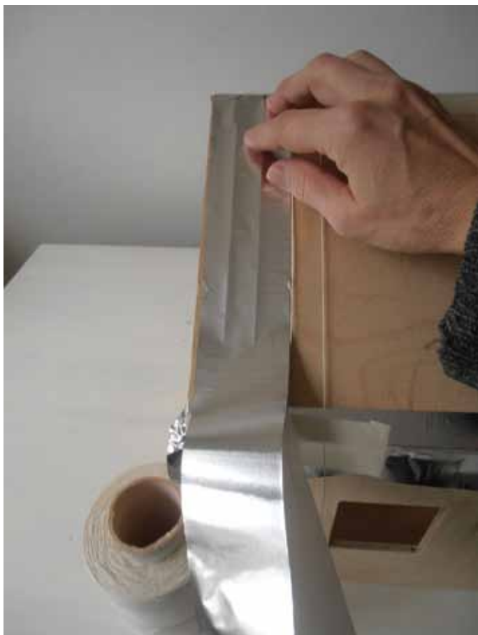
3. Aseta teippi lankojen päälle ja paina teippi kiinni mukailten kohokohtia.