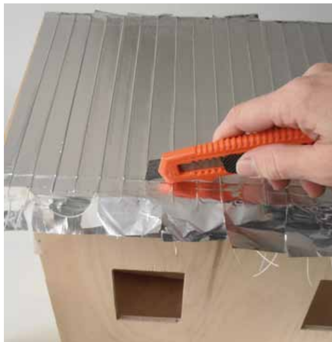
5. Leikkaa varovasti ylimääräiset teipit ja langanpätkät pois. Jos käyttää metallilankaa tai muuta tässä vaiheessa hankalasti leikattavaa, katso, että ne ovat sopivan pituisia jo alussa.