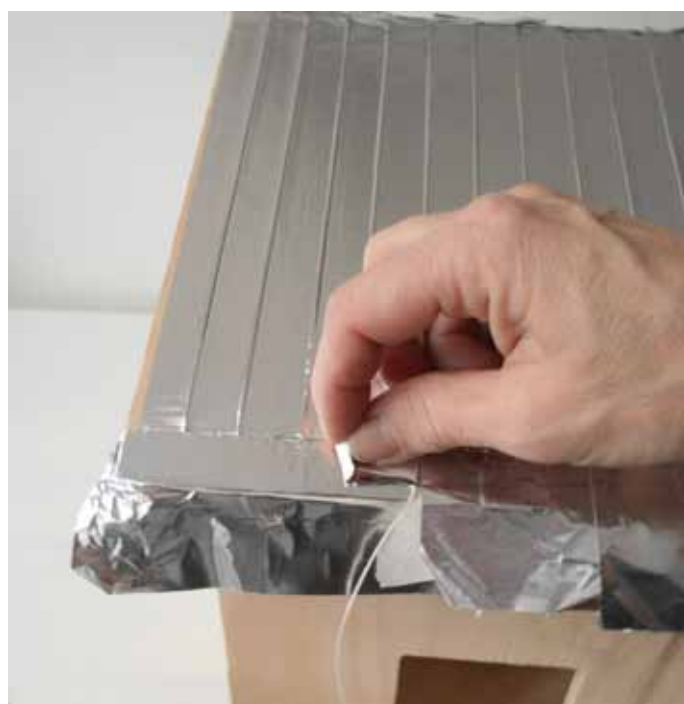
6. Ota tukiteipit pois.