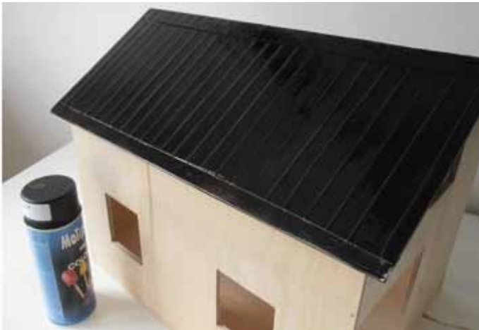
9. Kiiltävällä spraymaalilla saadaan aidon näköinen pinta.