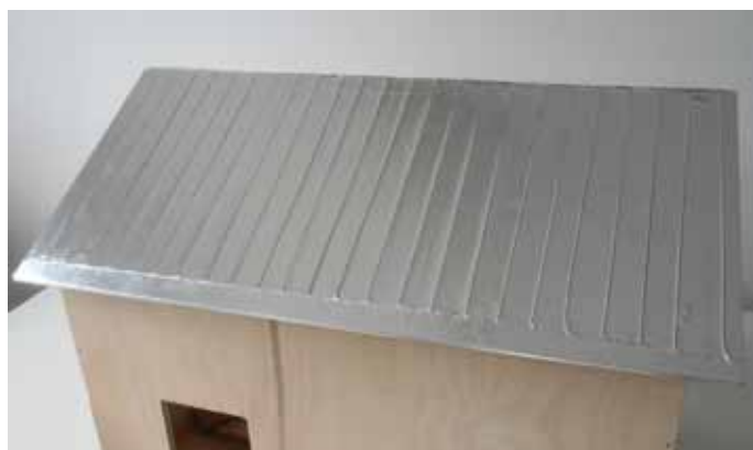
7. Valmis, maalaamaton peltikatto näyttää tältä.