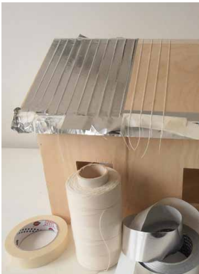
4. Jatka lankojen kiinnittämistä ja folioteipillä teippaamista kunnes koko katto on valmis.