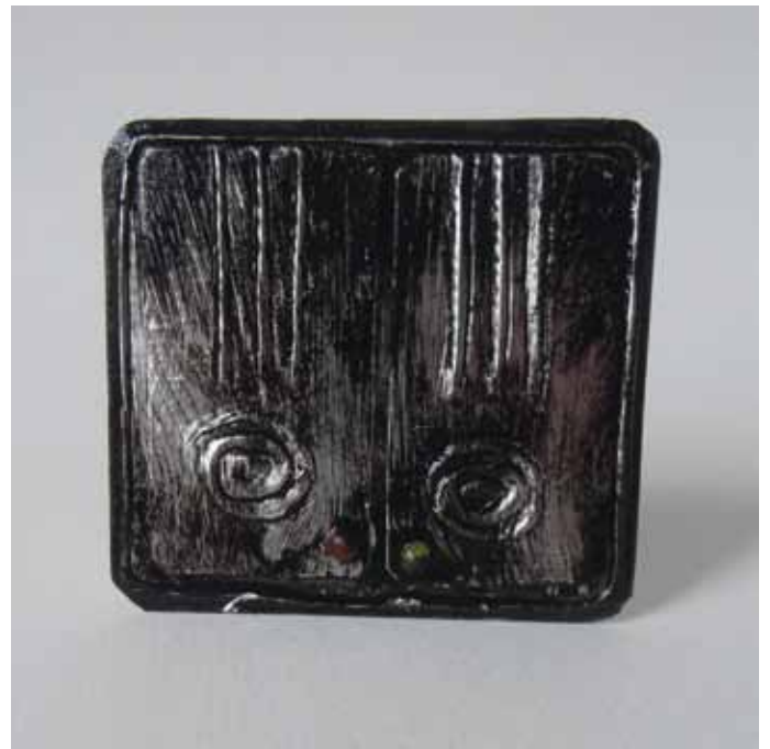
4. Kuviokohtia voi korostaa hiomalla niiden päältä varovasti. Jos haluaa kuluneet uuninluukut kuten tässä, hiotaan hiekkapaperilla reilusti maalia pois.