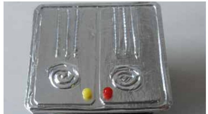
3. Liimaa luukkujen nupit paikoilleen.